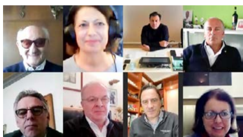
TAVOLA ROTONDA PARTECIPANTI