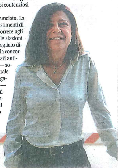
Paola De Micheli Ministro delle Infrastrutture